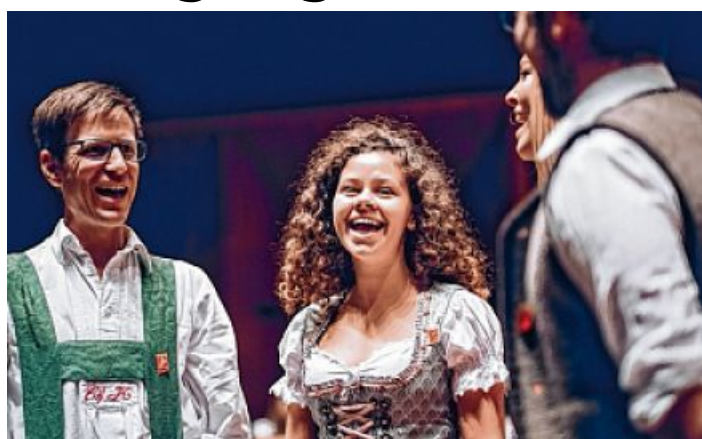
Tirols Volksmusikantinnen und -musikanten dürfen sich wieder auf einige besondere Veranstaltungen freuen.

Der Höhepunkt: Die Auf- führungen des beliebten Ti-