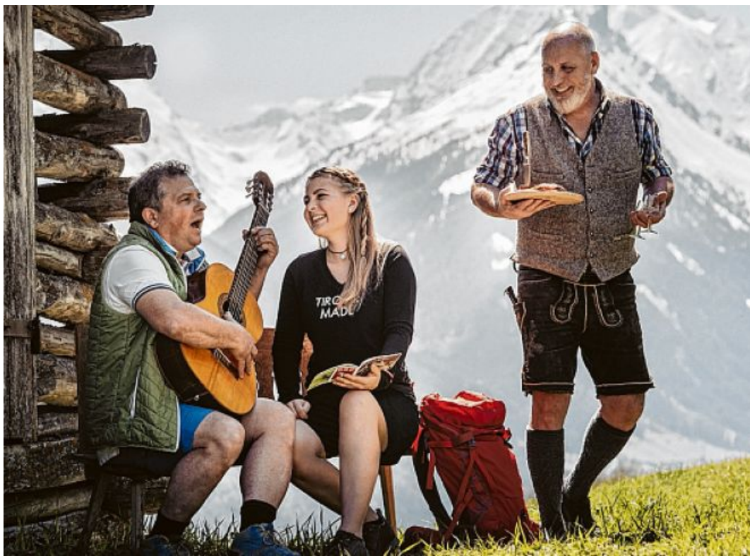
„Steig' ma's auffil!“ – das neue, kostenlose Alm- und Bergliederheft des Tiroler Volksmusikvereines und des Südtiroler Volksmusikvereines.

Das gemeinsame Singen ist ein wichtiger Bestandteil unserer Volkskultur. Der Tiroler Volksmusikverein bietet eine Vielzahl an Möglichkeiten des gesanglichen Zusammentreffens.