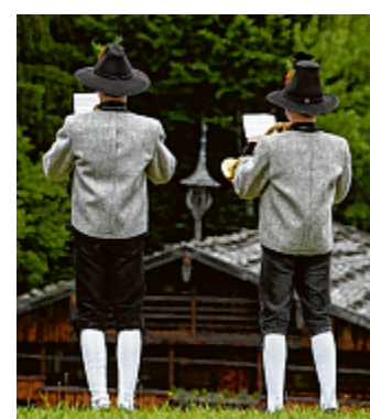
Das Museum Tiroler Bauernhöfe stellt sich wieder ins Zeichen der Volksmusik.

Heuer zum dritten Mal laden der Tiroler Volksmusikverein und das Museum Tiroler Bauernhöfe gemeinsam ein, Musik- und Gesangsgruppen aus dem ganzen Land in vielfältigster Besetzung zu erleben. Von feinen